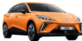
● Pomarańczowy „Fizzy Orange” trójwarstwowy