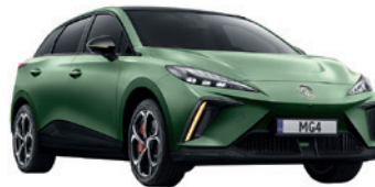
● Zielony „Hunter Green” matowy