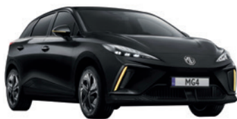
● Czarny „Pebble Black” metalik

Wybierz wariant wyposażenia: Standard, Comfort, Luxury, Luxury Long-Range, XPOWER, i przyciągaj spojrzenia, gdziekolwiek pojedziesz.