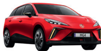
● Czerwony „Diamond Red” trójwarstwowy