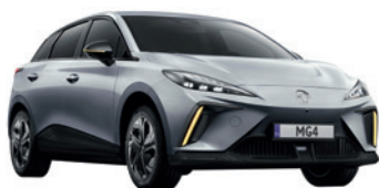
● Srebrny „Medal Silver” metalik